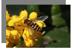
Foto- en/of filmopname: Publicatie kan alleen met toestemming van mede-deelnemers, gasten, organisator en/of eigenaresse.

Alleen in overleg met eigenaresse of organisator kan van deze regel afgeweken worden.